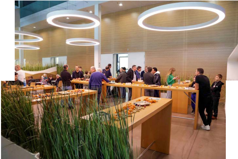
Der Verpflegungsbereich mit den offerierten Leckereien.