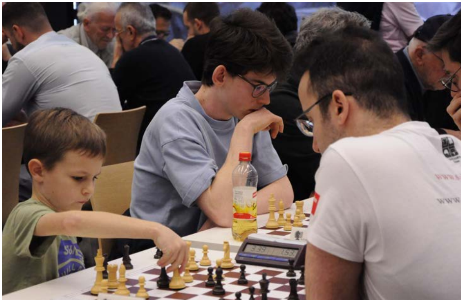
Keiner zu klein, um Meister zu sein!