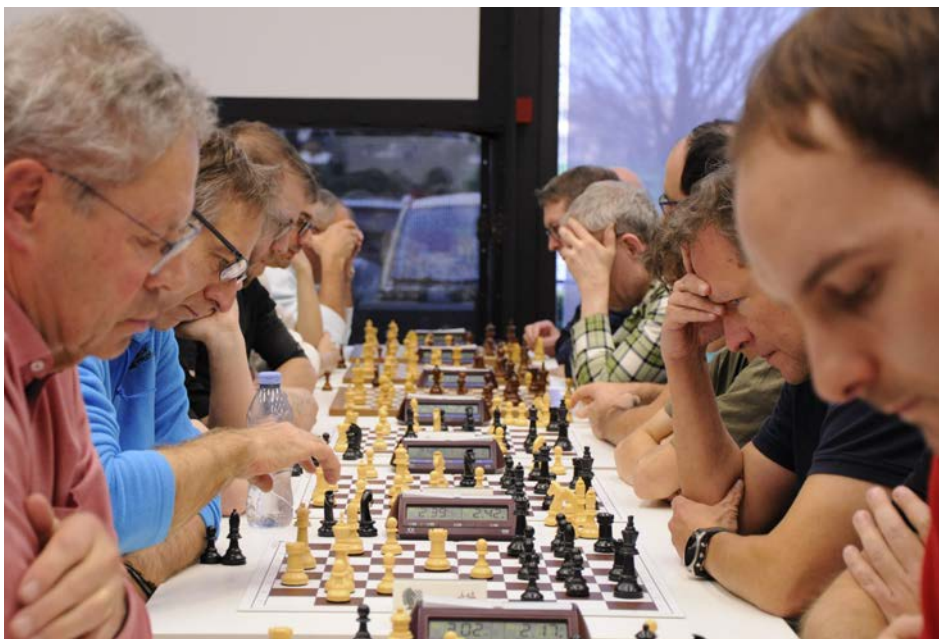
Die Innerschweizer sind hier mit acht Spielenden zahlen- und leistungsmässig sehr stark vertreten.